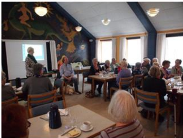
Blinde, Søren Høg: Fra Skagen til Fakse. 2018