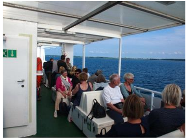
Færgen Skarø – Svendborg