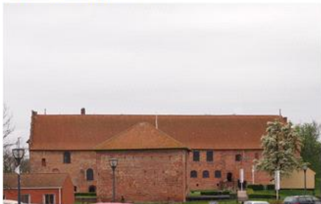
Danehof Slottet i Nyborg