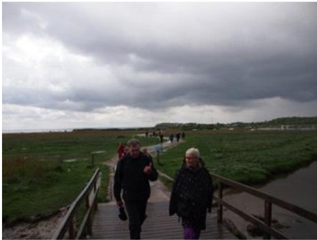
En dejlig tur, men våde blev vi da, Torø 2014