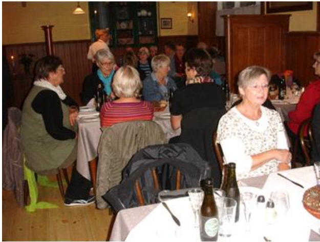
Frokost i Arbejdermuseet restaurant