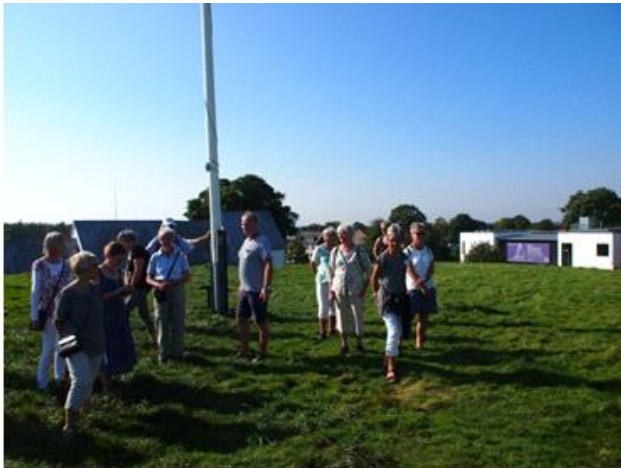
Her står vi midt i Jelling Kongsgård