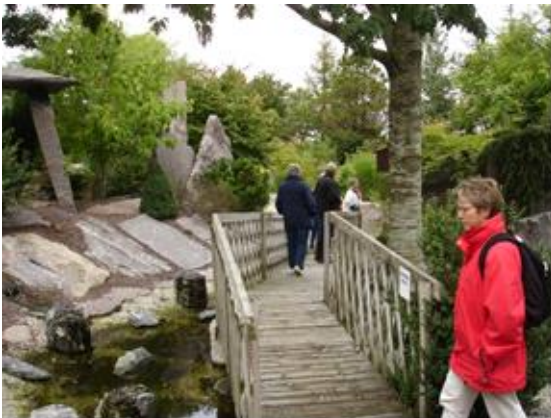
Meget vand og mange broer