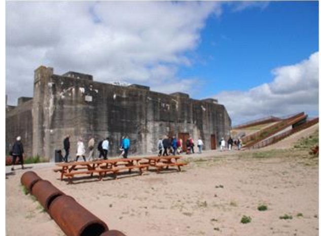
Den gamle kanonbunker Tirpitz ved Blåvand