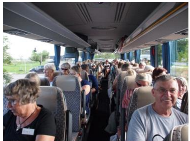
Hjem igen efter et royalt kik i Jelling