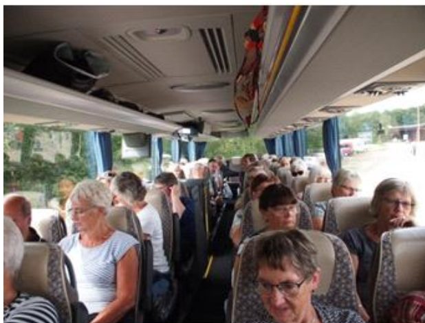
Hjemtur efter en lang dag i det fri.