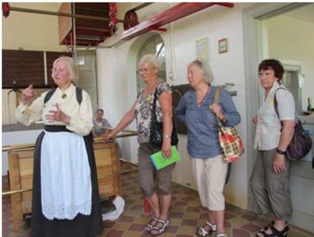
En tur på mejeriet.