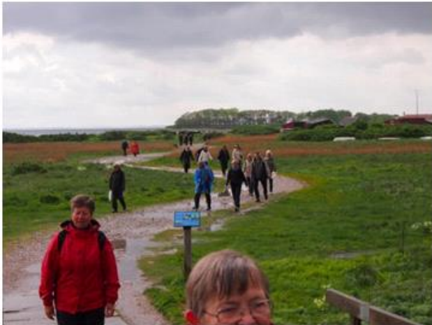
Regnen holdt inde da vi var færdige Torø 2014