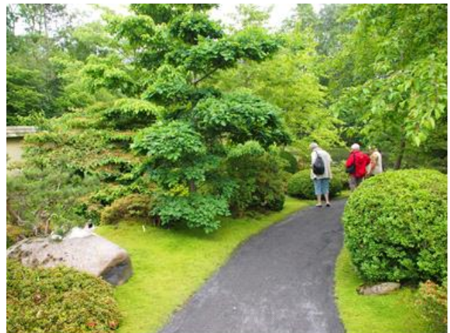
Der var meget at se