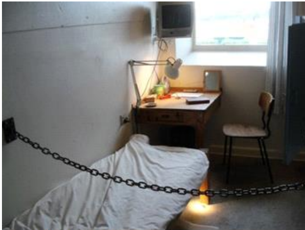
Fængslet 2, Horsens, 2015