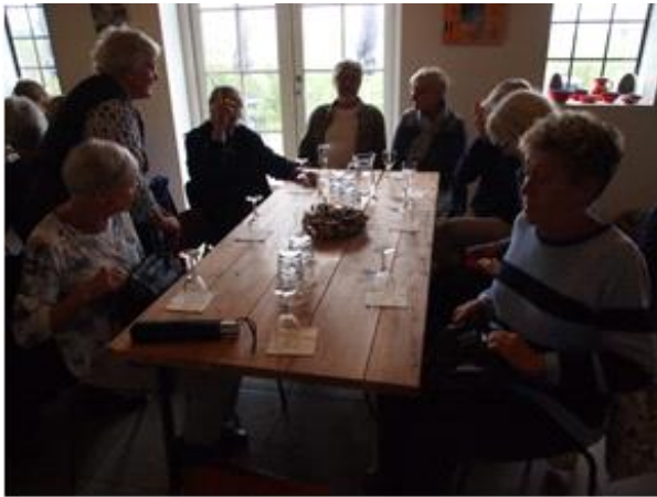
Vinsmagning på Årø Vingård