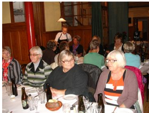
Frokost i Arbejdermuseet restaurant