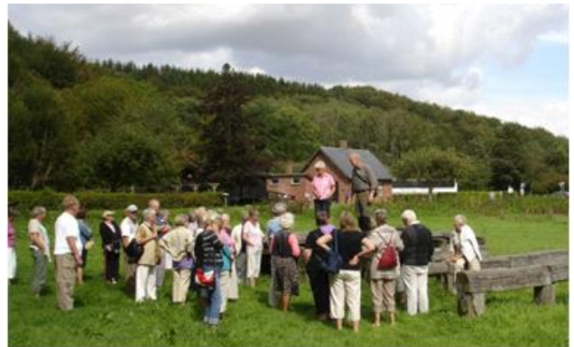
Rester af Vikingebroen i Vejle Ådal