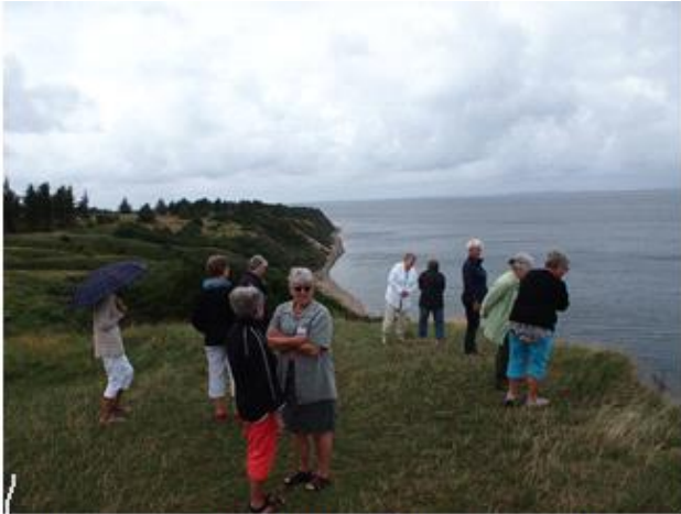
Et vue over Limfjorden fra Molerskrænterne