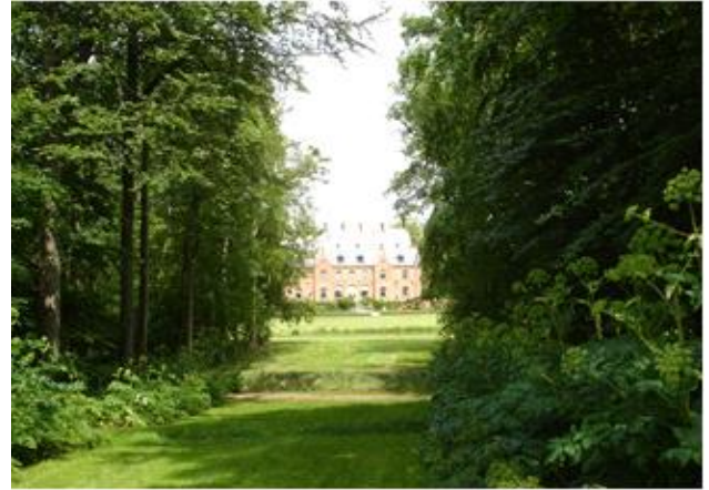
Kvanalleen ned Sanderumgaard, Hoverhuset