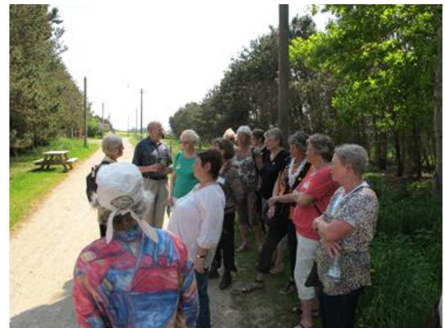
På guidet tur rundt i Nyvang