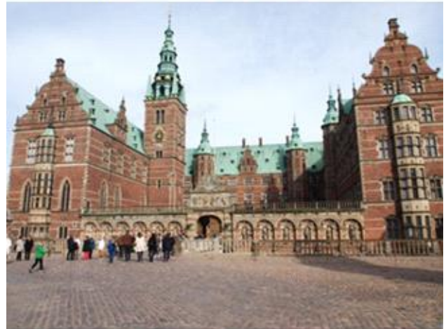
Frederiksborg Slot 2014