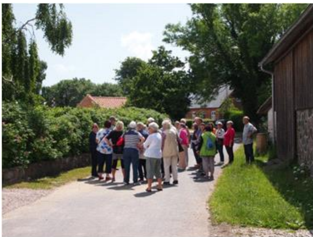
Guidet tur i Skarø by