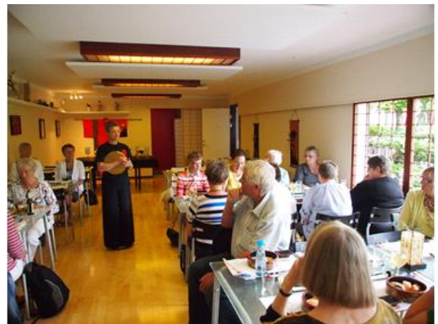
Lidt japansk frokost skulle vi også have, på japansk, med pinde forstås