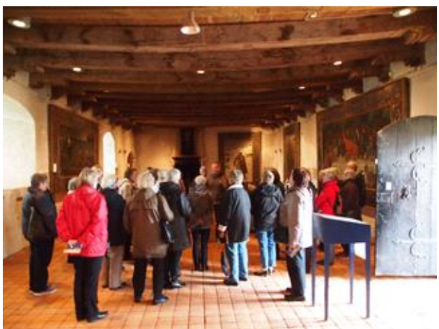
Så er vi kommet indenfor i Riddersalen