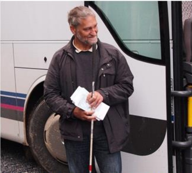
Vores senblinde guide, noget af en god oplevelse