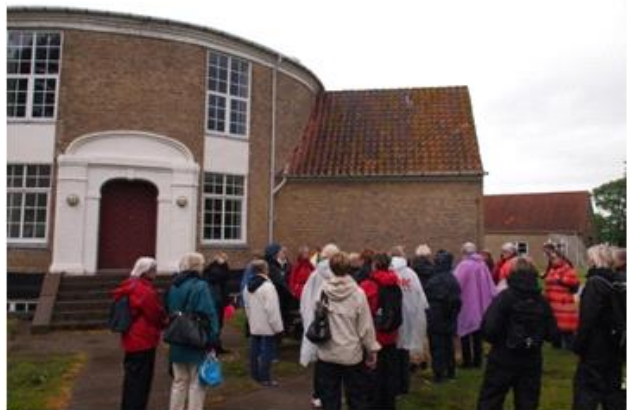
Gæstehuset på Torø 2014