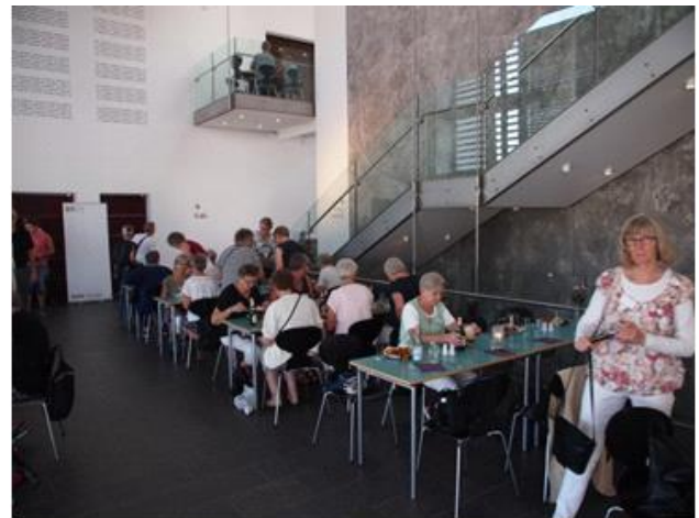
En frokost skal der også til