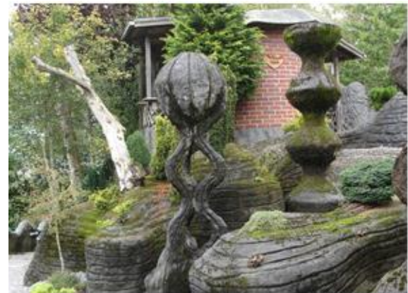
Der er brugt megen fantasi