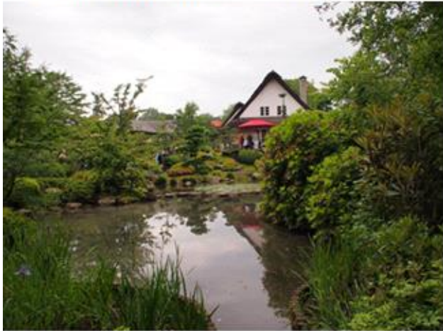
Regnen gjorde det haven frodigt