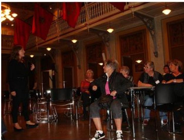
Guiden fortæller i Museets Festsal