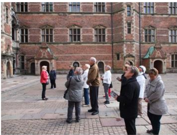
Guiden i slotsgården Frederiksborg Slot 2014