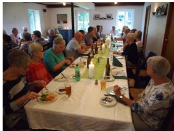
Frokost på Aarøgaard 2018