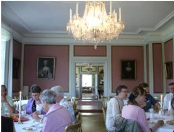
Kaffe og kage på Ulriksholm