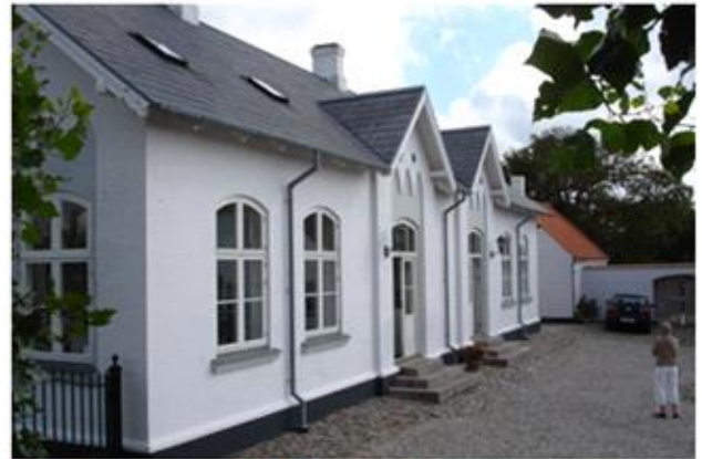
Galleri Bent Moseholm 2009