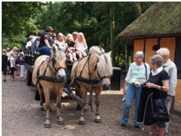
Behagelig sightseeingtur på Hjerl Hede 2017