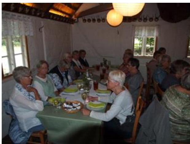
Tur til Hjerl Hede 2, 2017