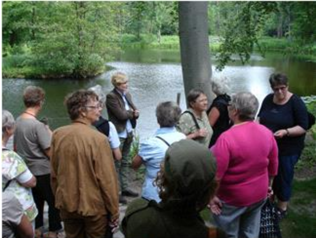
Rundvisning med selve Kammerherreinden