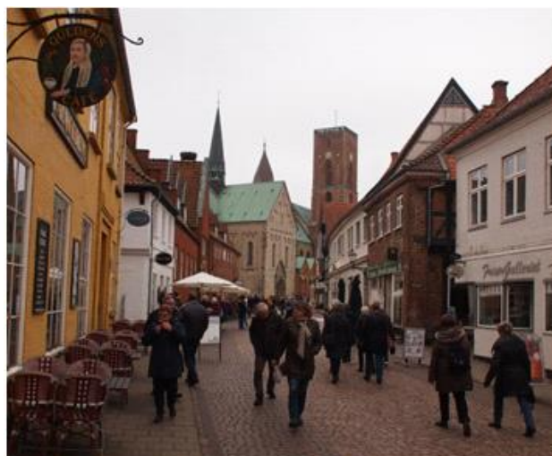
På vej til Hotel Dagmar, Ribe 2018