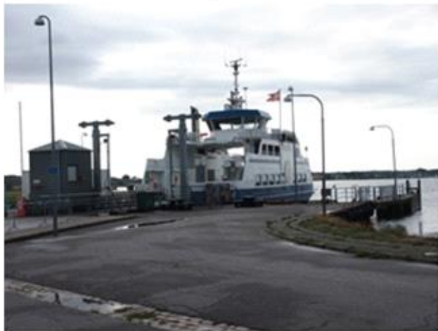
Færgen Aarøsund – Aarø