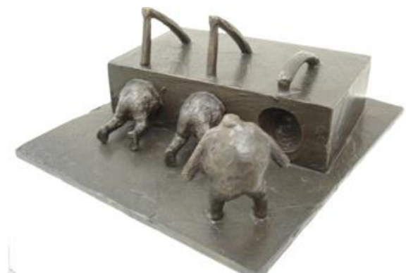
Galleri Bent Moseholm 2009