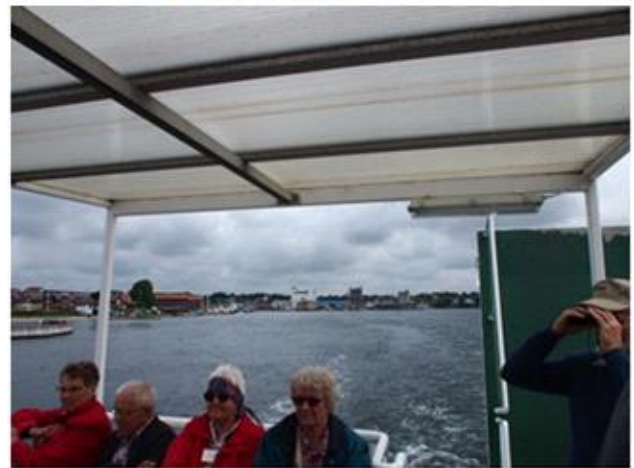
Færgen Svendborg – Skarø