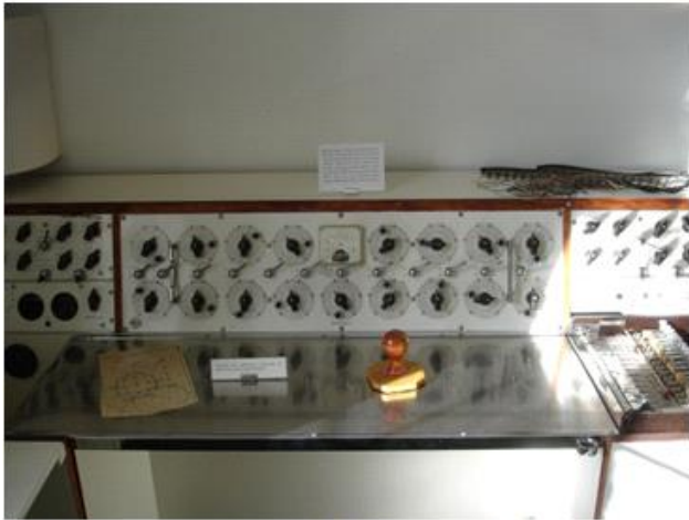
EEG-instrument til registrering af elektriske aktiviteter i hjernen ved hjælp af elektroder