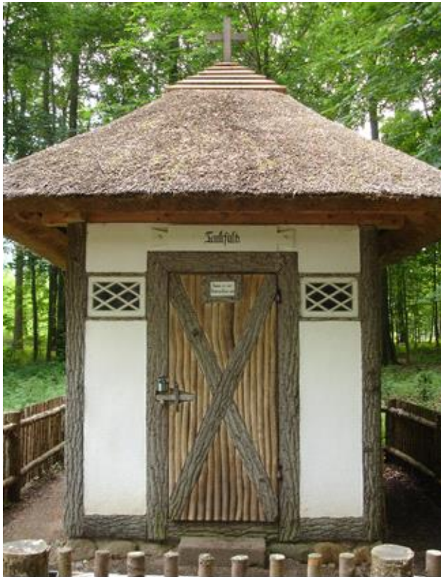
Nej det er ikke noget toilet, men et rum til tanker.