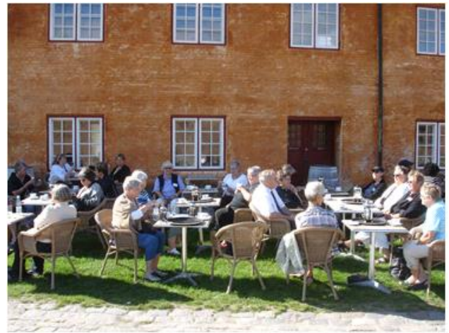
Dejligt med en kop kaffe