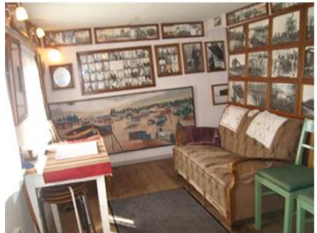
Interiører med udstilling arbejderbolig