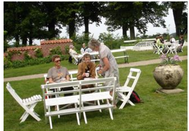
Dejligt med en kop kaffe!