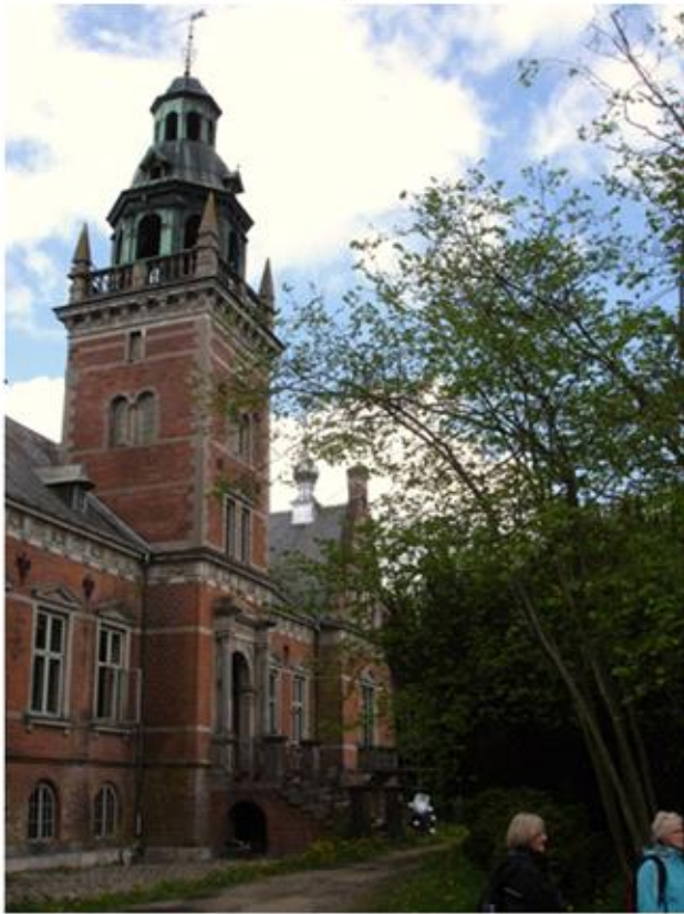
Hesbjerg Slot 2010