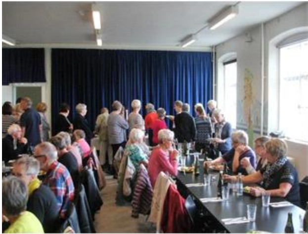
Fængslet 3, Horsens, 2015