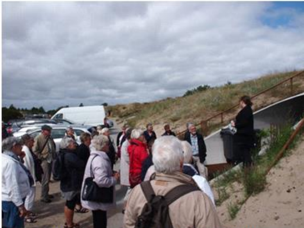
Introduktion til Tirpitz Bunkeren ved Blåvand