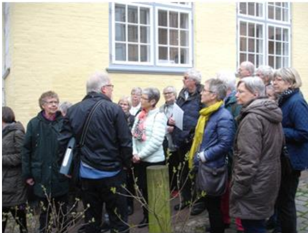
Guidet byvandring i Flensborg