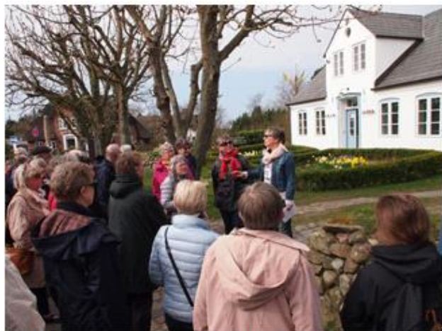
Rundtur med guide i Keitum