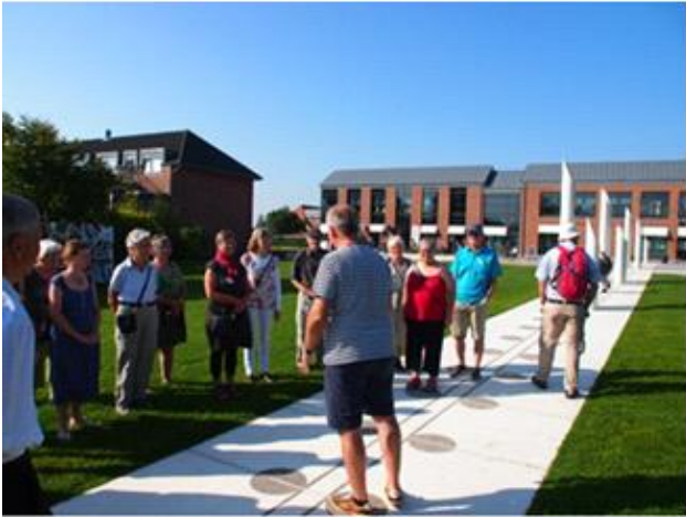
En tur rundt i Jelling Kongsgård