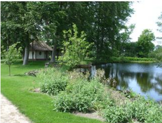
Det var faktisk rigtig romantisk.