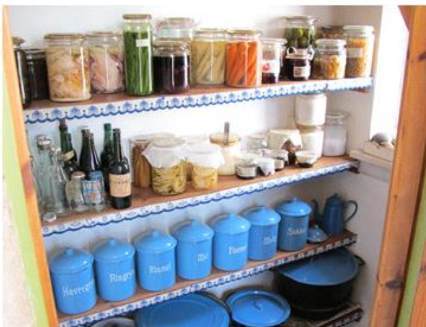
Spisekammeret med henkognings glas.