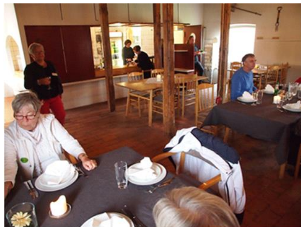
Frokost Gl. Estrup 2015