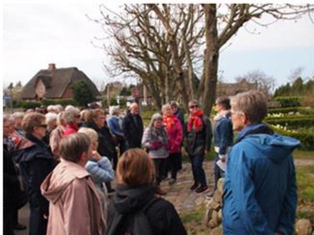
Rundtur med guide i Keitum