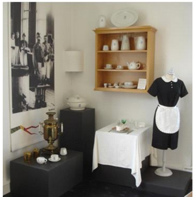
Service der blev brugt på hospitalet