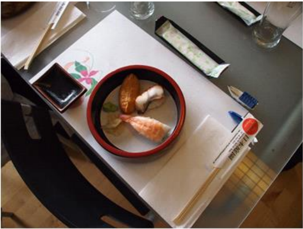
Så er der serveret