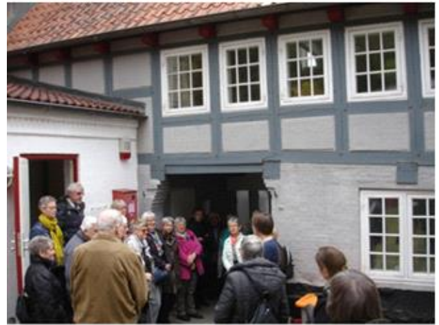
Et af værkstederne