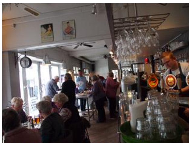
Frokost skal vi jo da også ha'!