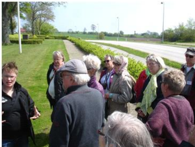
Guiden fortæller om mindesmærkerne