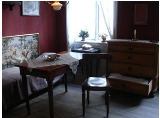
Interiør af lejlighed fra 1915