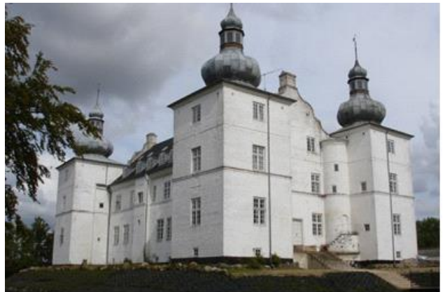
Herregården Engelsholm. Nu Højskole