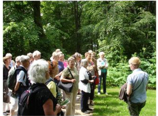
Der blev gjort meget ud af fortællingen, om renoveringen af Den Romantiske Have