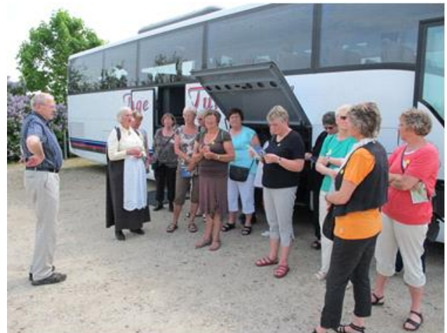
Guide introduktion til Nyvang.