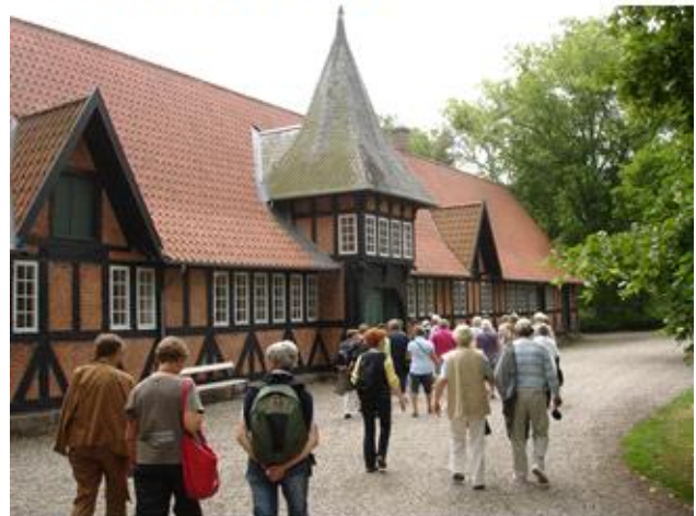
Vel ankommen, på vej ind i den gamle hestestald