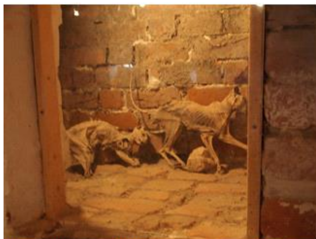
Disse skeletter af katte, har været muret inde i væggen. Overtro?