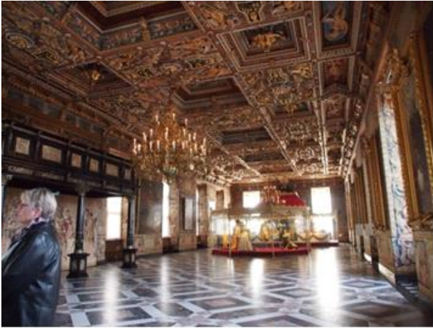
Riddersalen Frederiksborg Slot 2014