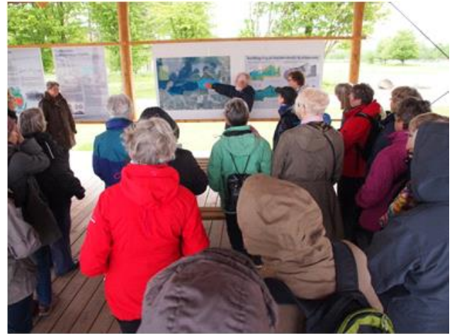
Introduktion til turen