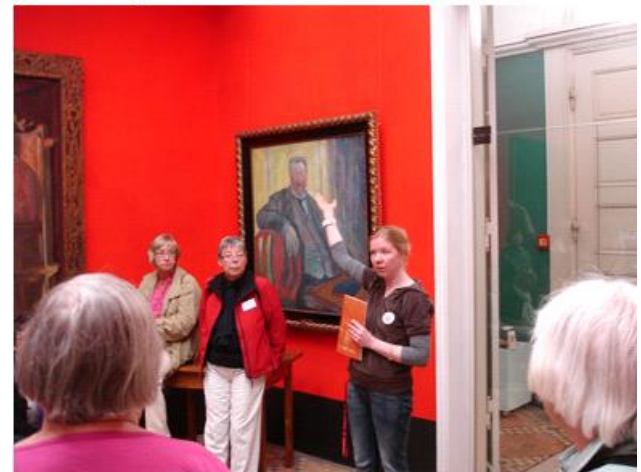
Guiden giver introduktion