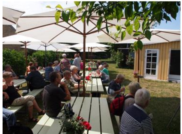
Vi venter på kaffen Cafe Sommersild