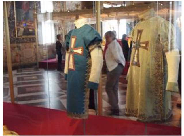
Slotsvagtuniformer fra 16-1700 tallet