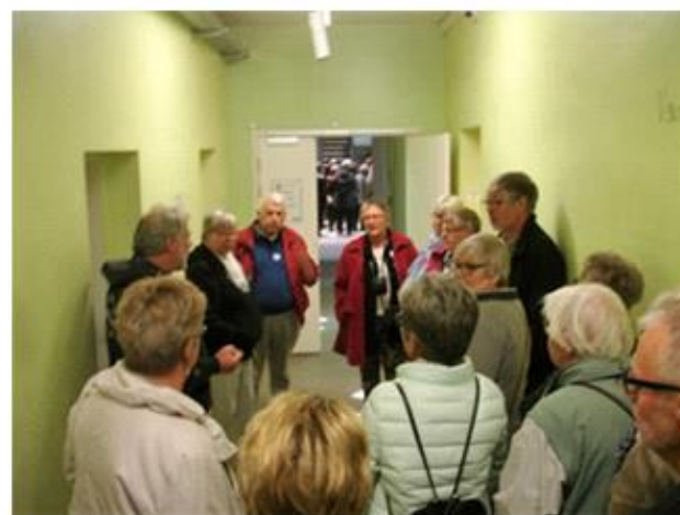
Fængslet 1, Horsens, 2015