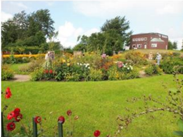
Emil Nolde Museet, Seeböll 1, 2015