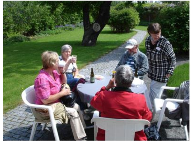
Kunst skaber sult