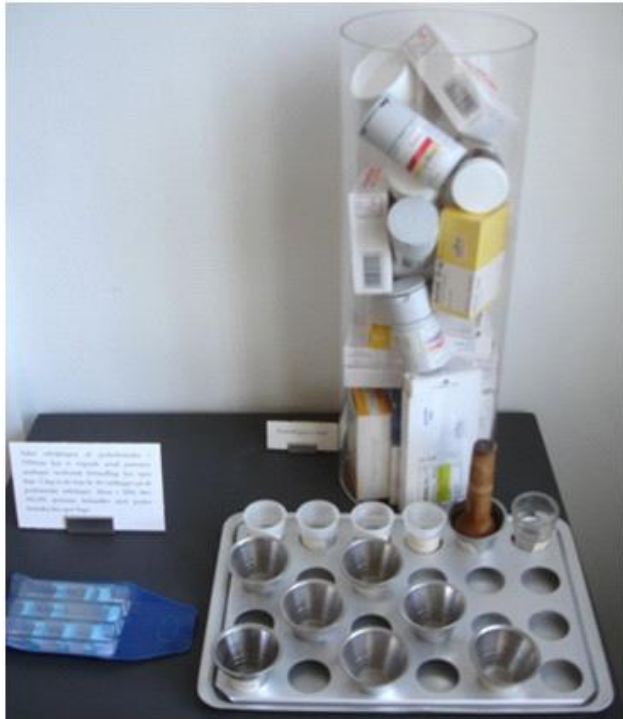
Egen læge er i dag den der udskriver medicin til de flest psykiatriske patienter