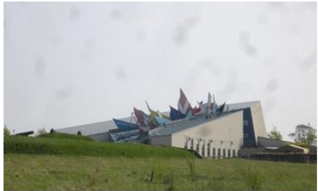
Historiecenter Dybbøl Banke