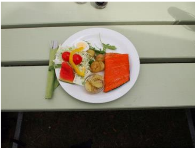
Det ser da lækkert ud