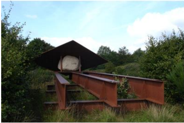
"Store" Roberts Jacobsens skulptur i Tørskin Grusgrav