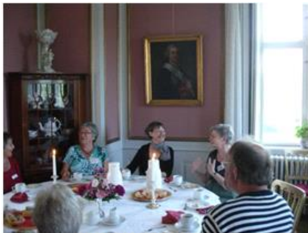
Kaffe og kage på Ulriksholm