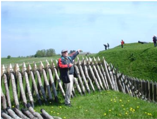
Palisadevæg og skanse