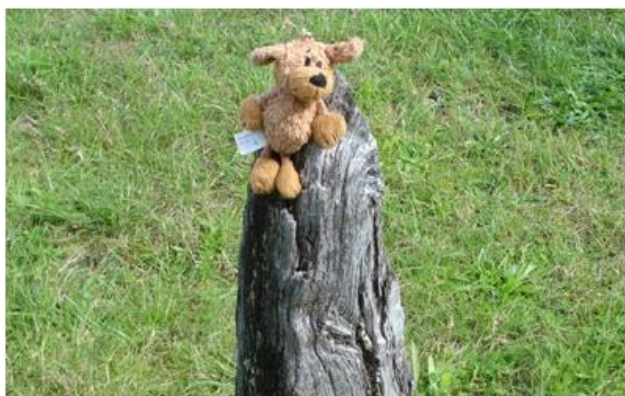
Humoristisk indslag i Tørskin Grusgrav