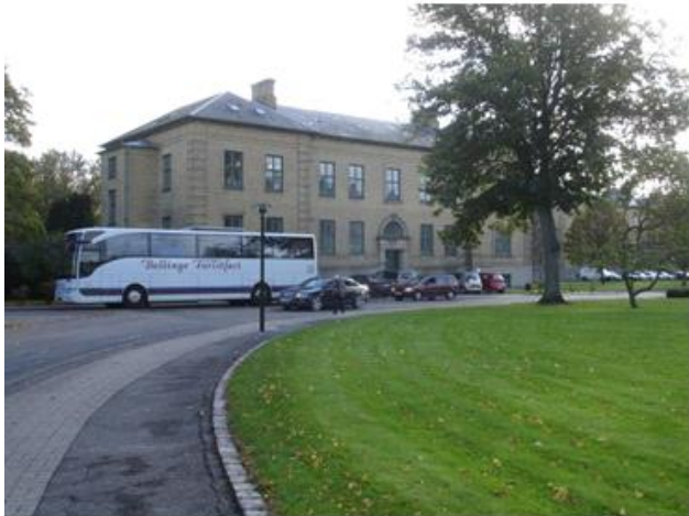
Det Psykiatriske Hospital