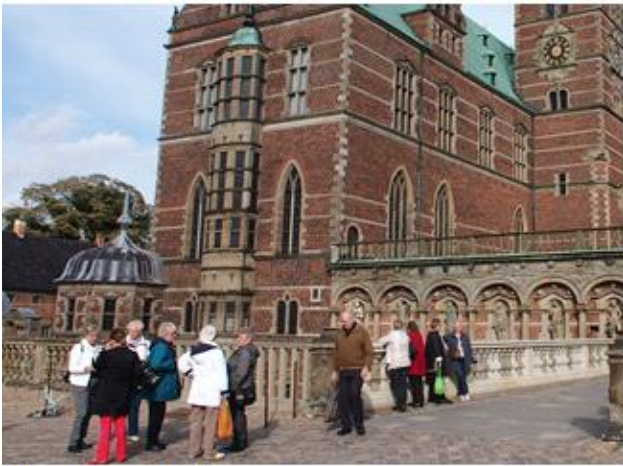
Vi venter på guiden