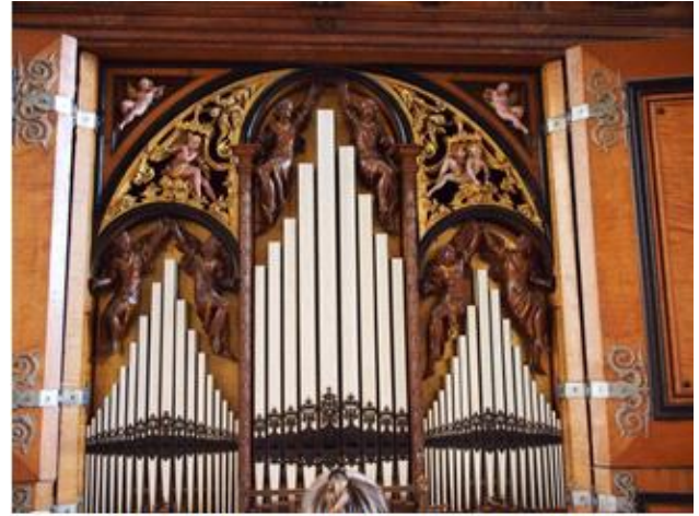
Compeniusorglet i Frederiksborg Slots Kirke