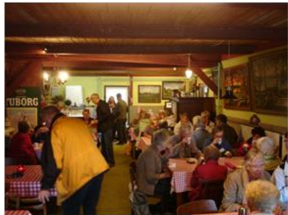
Det er altid godt med en kop kaffe