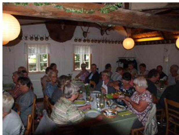
Frokost i Skyttekroen, Hjerl Hede 3, 2017