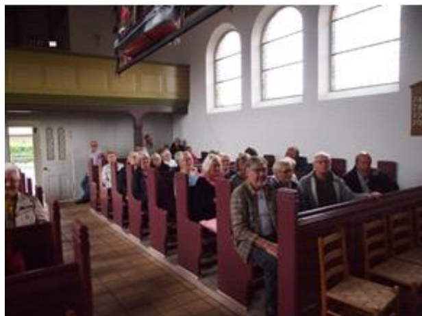
Veteraner i Julekirken, Aarø