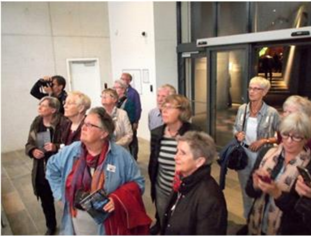
Moesgaard Museum 2, Aarhus, 2015