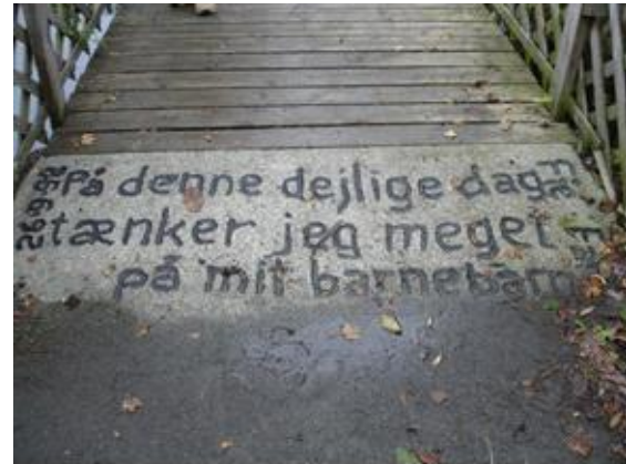
Lidt at tænke over, inden du går over broen