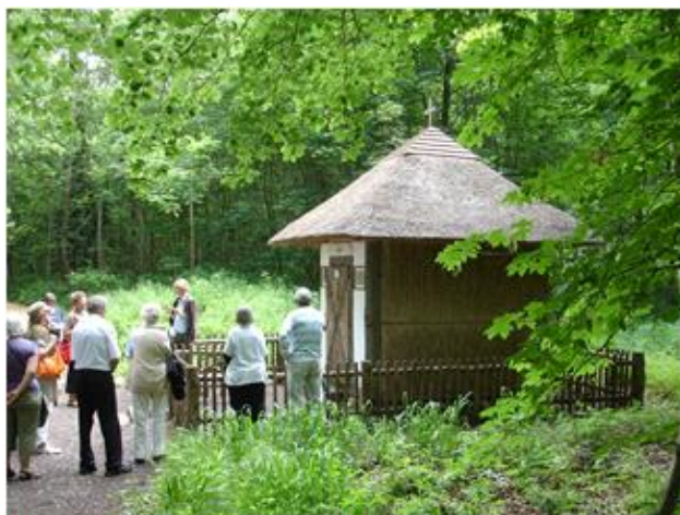
Der var ingen der gik ind! Bange for tankerne?