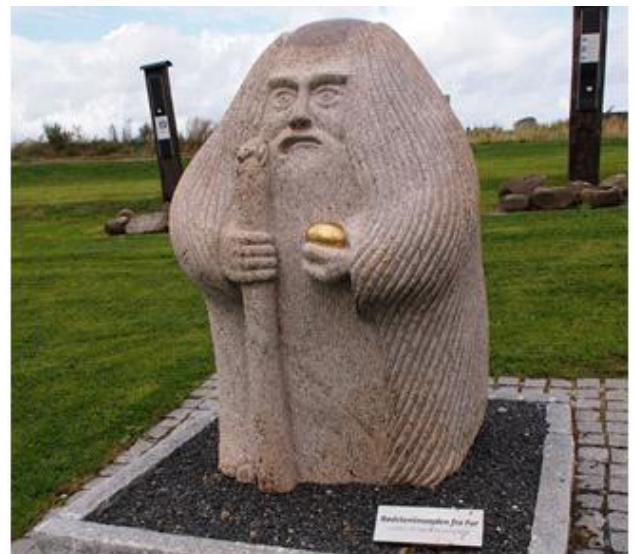
Rødstensmanden fra Fur