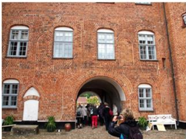
Tur til Gl. Estrup 1, 2015