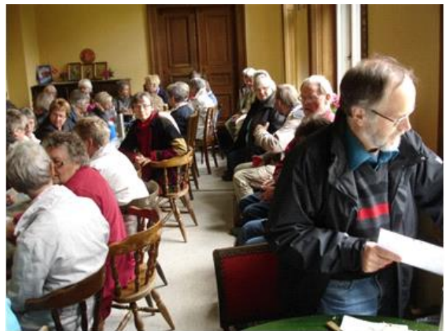
Frokost i samlingsstuen