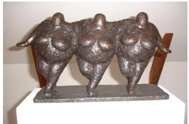
Galleri Bent Moseholm 2009