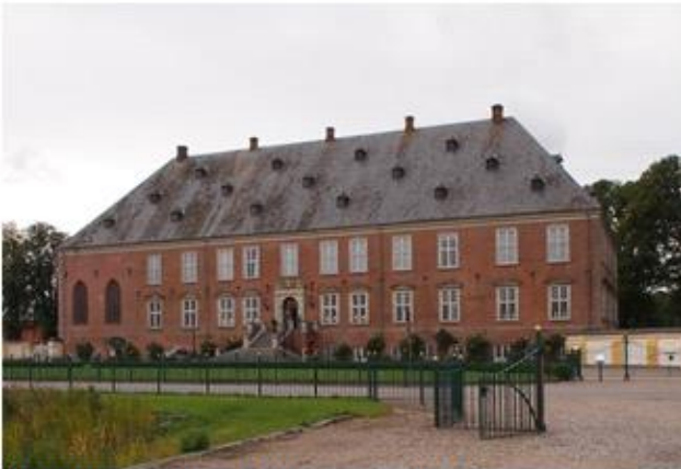
Valdemar Slot, Tåsinge 1, 2017