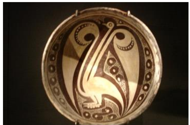
Abstraktion over en fugl, Davids Samlinger 2009