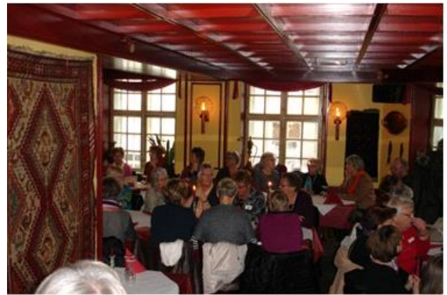
Frokost i Ankara 2009