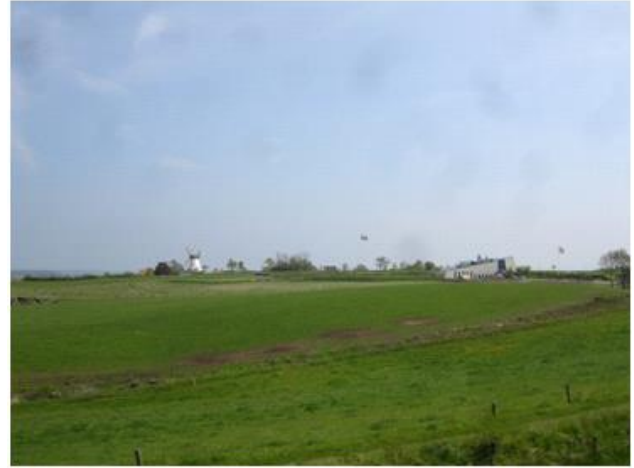
Dybbøl Mølle og Historiecenter Dybbøl Banke