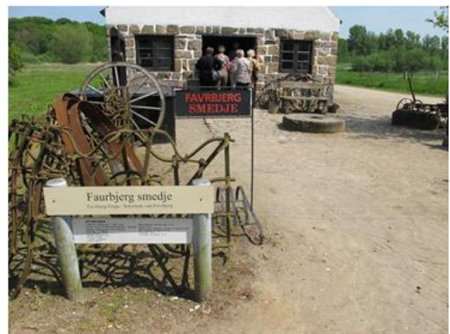
Hos smeden. Mon nogen fik nye sko?