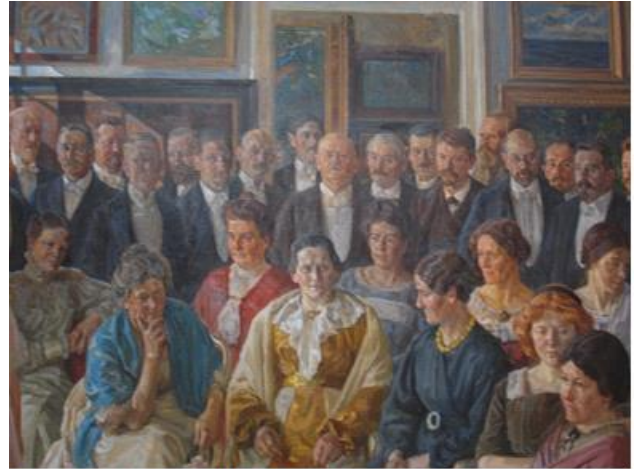
Kunstnerne og deres mæcener