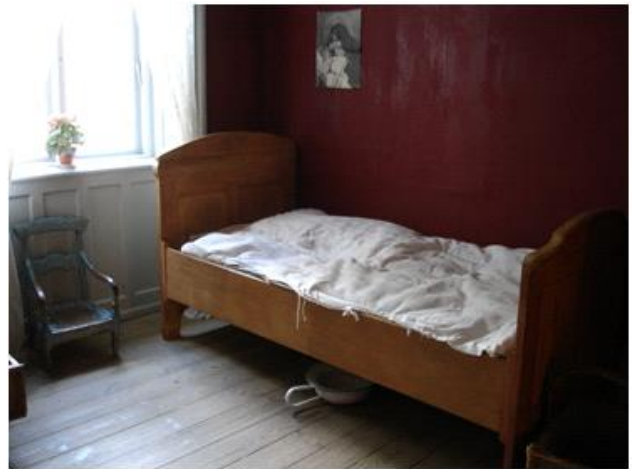
Interiør af lejlighed fra 1915