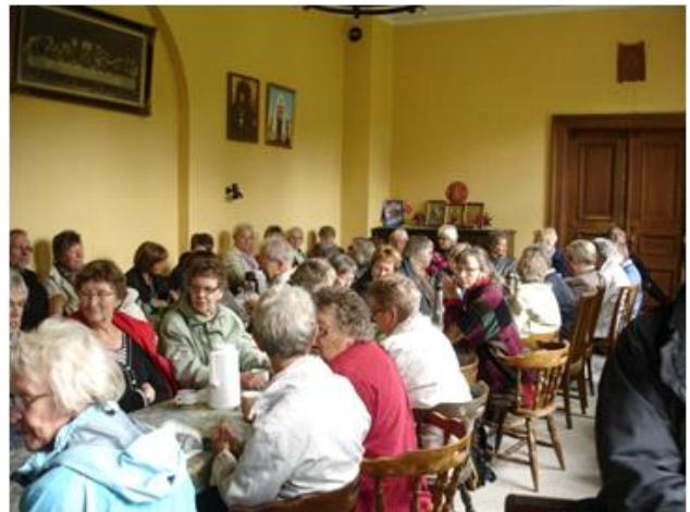
Frokost i samlingsstuen