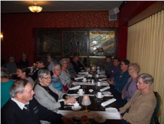
Frokost på Hotel Dagmar i Ribe 2018