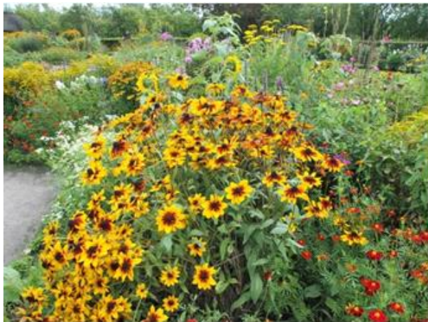
Emil Nolde Museet, Seeböll 2, 2015