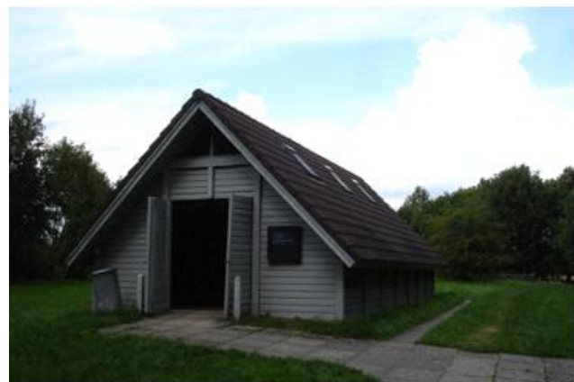
Udstillingshus for udgravning Egtvedpigens gravhøj