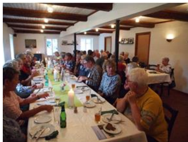
Frokost på Aarøgaard 2018