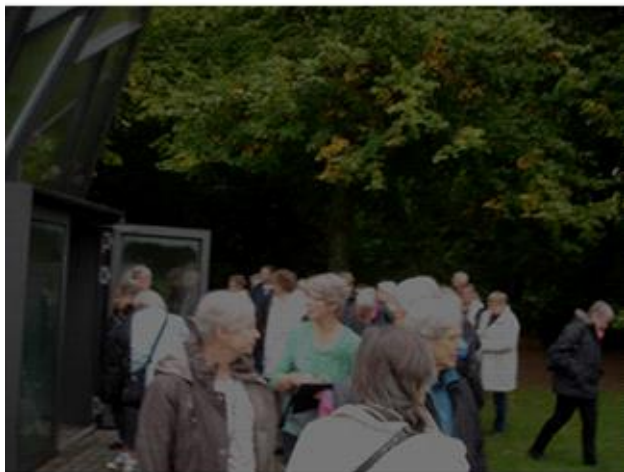
Indgangen til Cisternerne