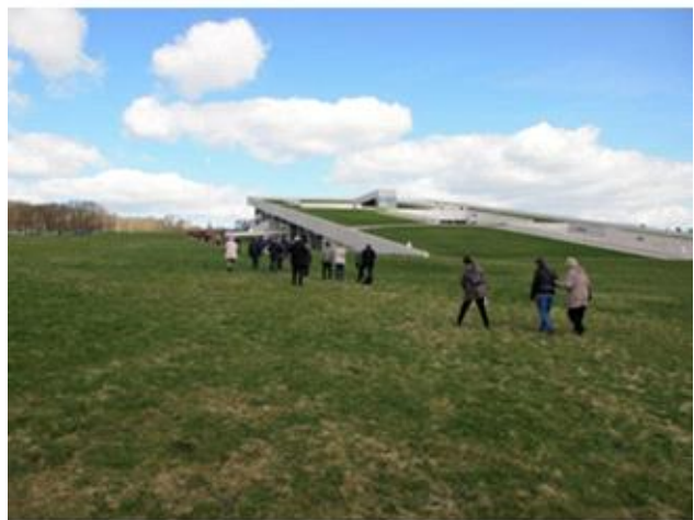
Moegaard Museum 1, Aarhus, 2015