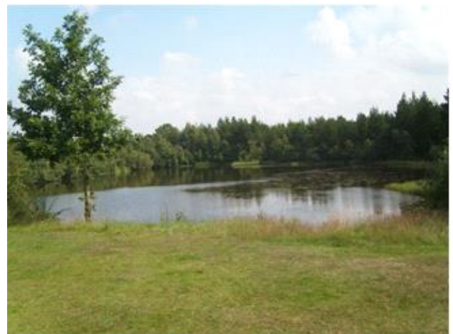
I dag ser der jo dejligt ud, men tidligere, da der blev gravet kul, var det knapt så romantisk.