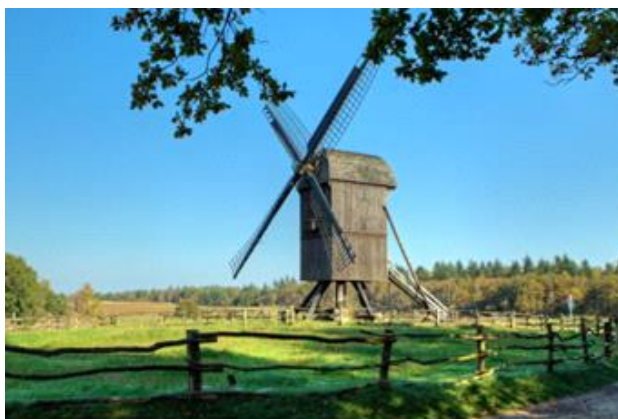
Tur til Hjerl Hede 4, 2017