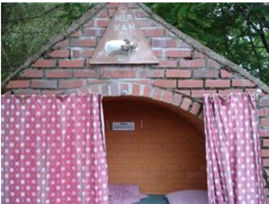
Tag en lur, hvis du er træt af at gå rundt