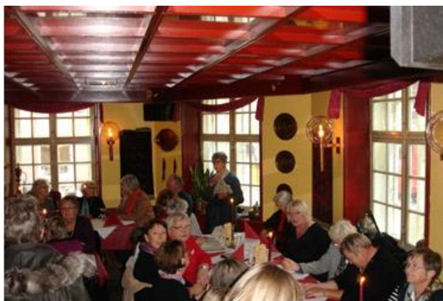
Frokost i Ankara 2009