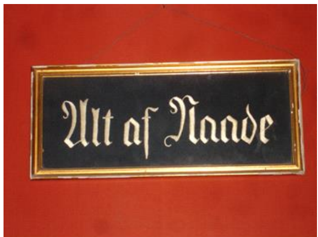
Formanende skiltbilled i Arbejdermuseet