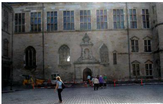
Kronborg Slots gård