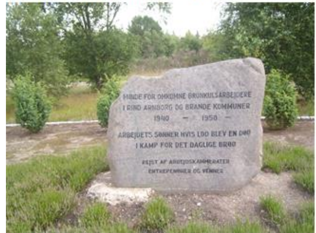
Mindsten over forulykkede arbejdere i Brunkulslejren