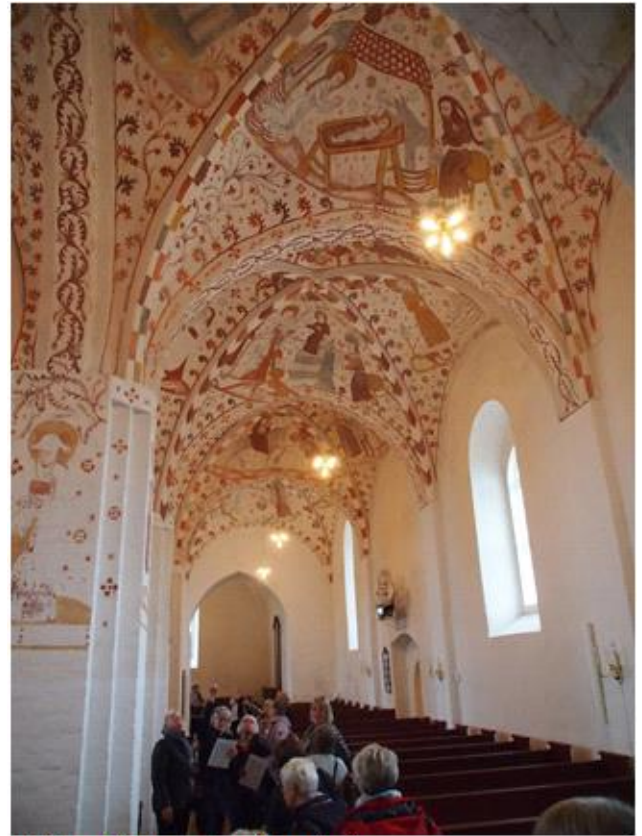
Kirkeskibet med kalkmalerier