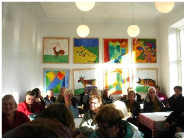
Guiden giver os introduktion til besøget