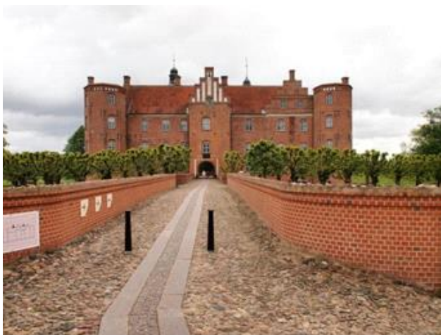
Tur til Gl. Estrup 2, 2015