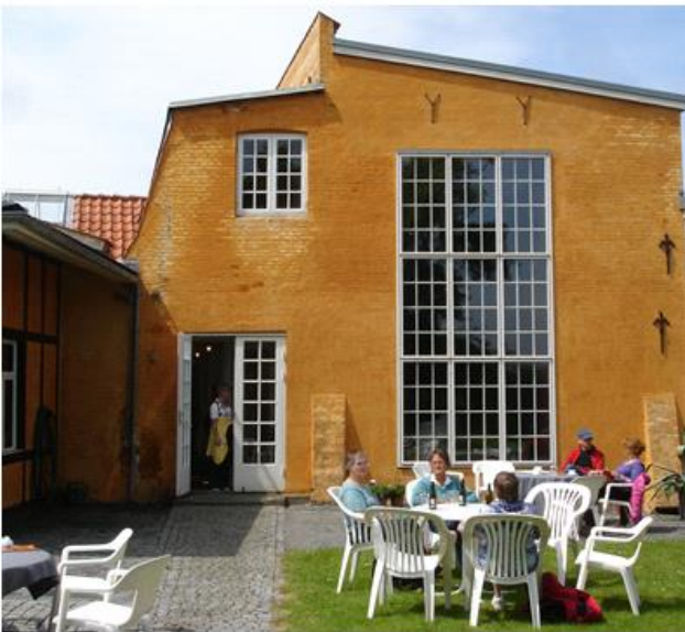
Haven bag Fåborg Kunstmuseum