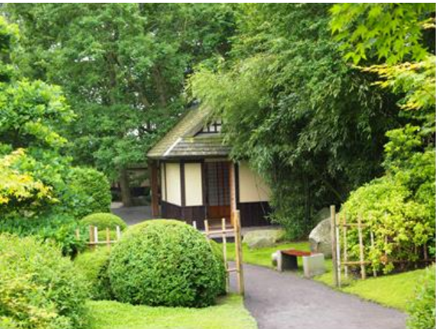
Det giver ro