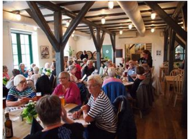
En frokost på Fur-Bryggeri