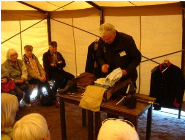
Gennemgang af soldaternes udrustning