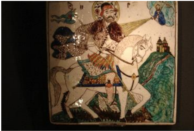
Tyrkisk flise, Davids Samlinger 2009