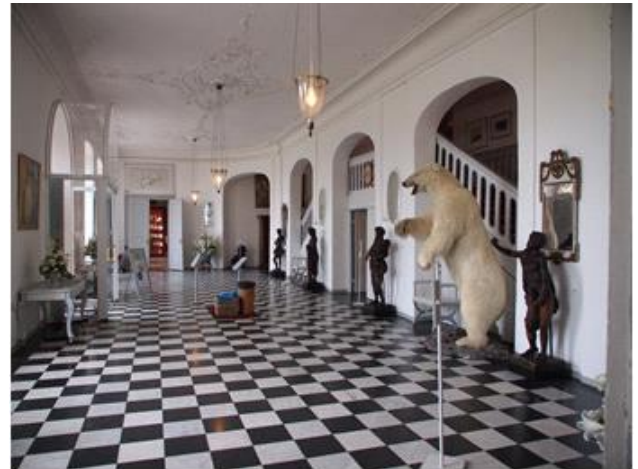
Valdemar Slot, Hallen 3, 2017