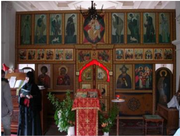
Russisk ortodoks kirke 2010