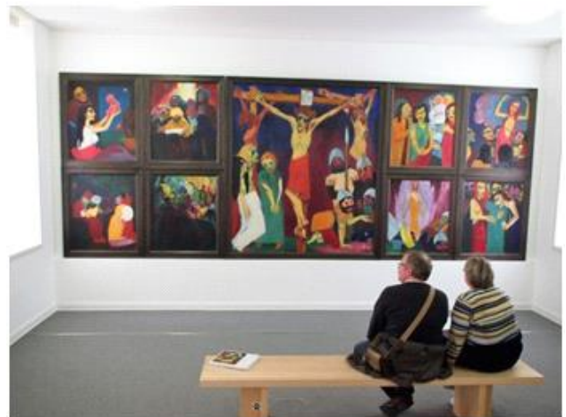
Emil Nolde Museet, Seeböll 3, 2015