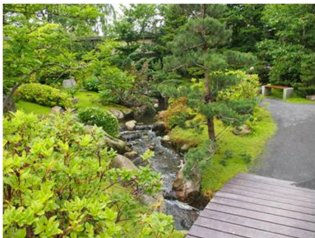
Flot og ordentligt