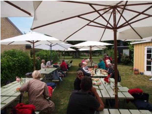
Så er der frokost i Cafe Sommersild