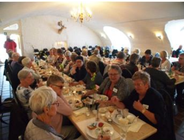
Valdemar Slot, Tåsinge 2, 2017