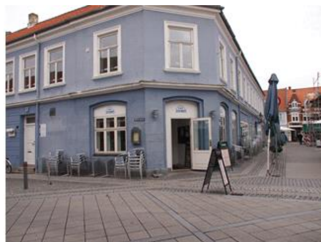
Cafe Anton, Nyborg