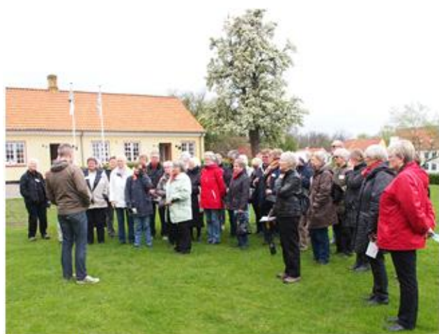
Introduktion til Nyborg Slot