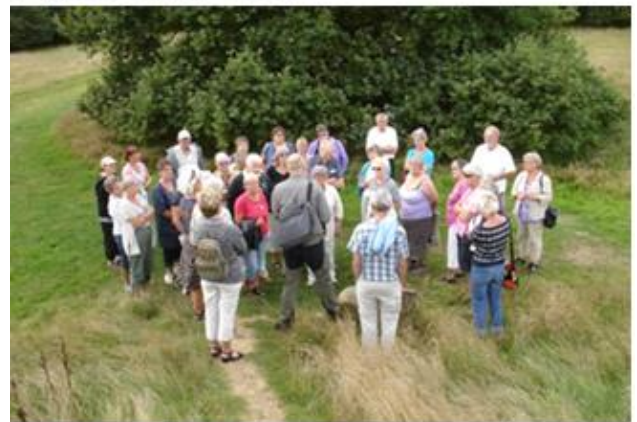
Ved Egtved pigens gravhøj