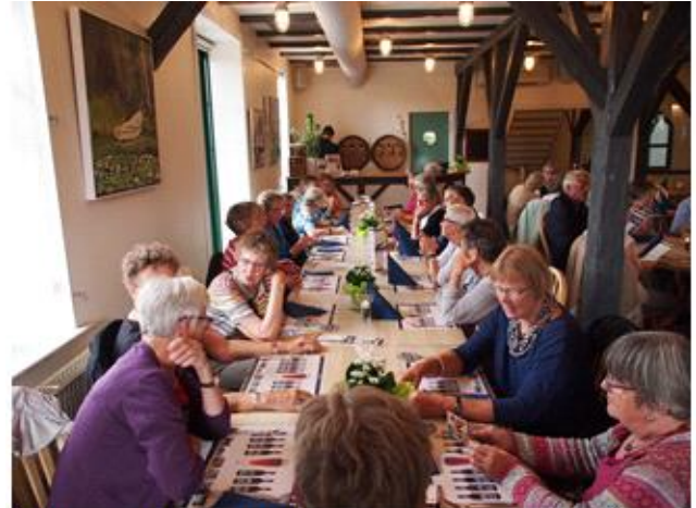
En frokost på Fur-Bryggeri var en god idé efter den lange køretur.