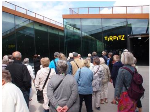
Indgangen til Tirpitzmuseet