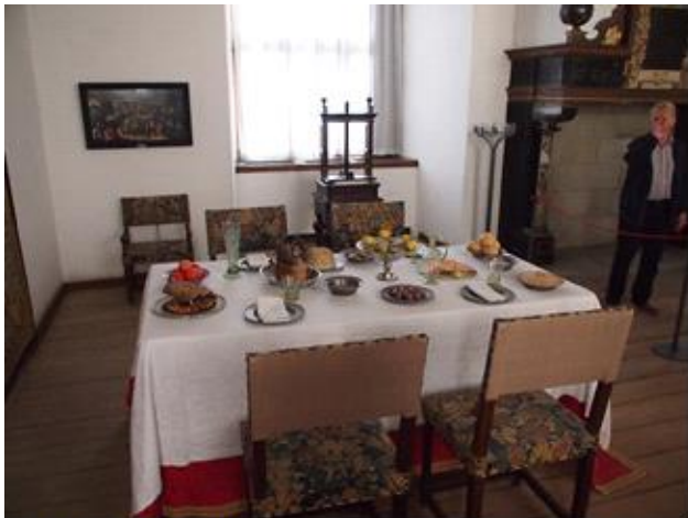
Så er der serveret