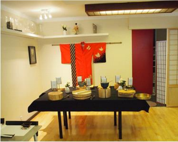
Det ser ikke ud af meget, men lækkert og enkelt