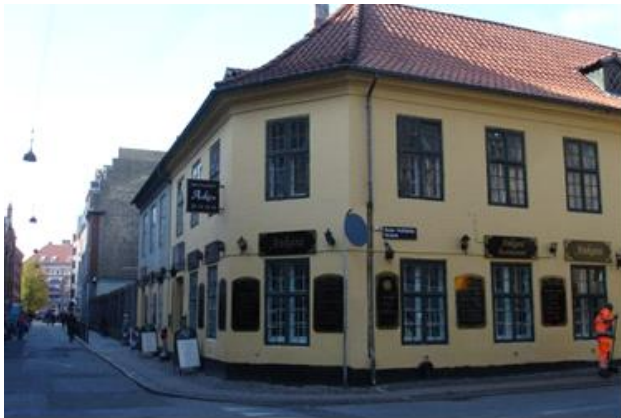
Frokost i Restauration Ankara 2009