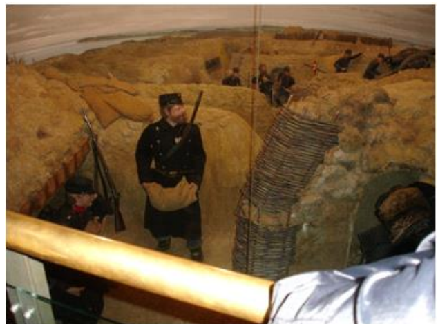
Rekonstruktion af skyttegrav