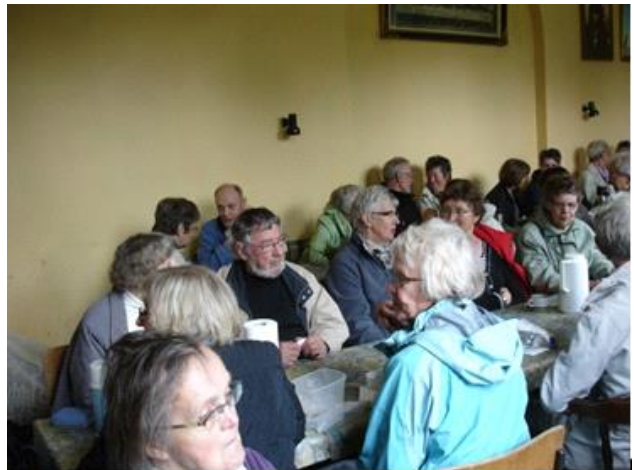
Frokost i samlingsstuen