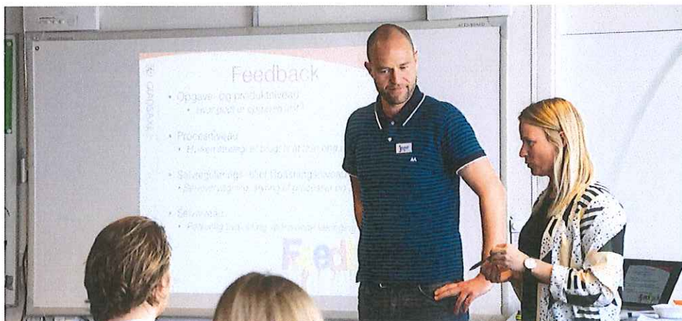
Foto: Fra uddannelsen i synlig læringsmål på GPV

Det er afgørende, at lærere og pædagoger har et højt fagligt niveau, og at lederne